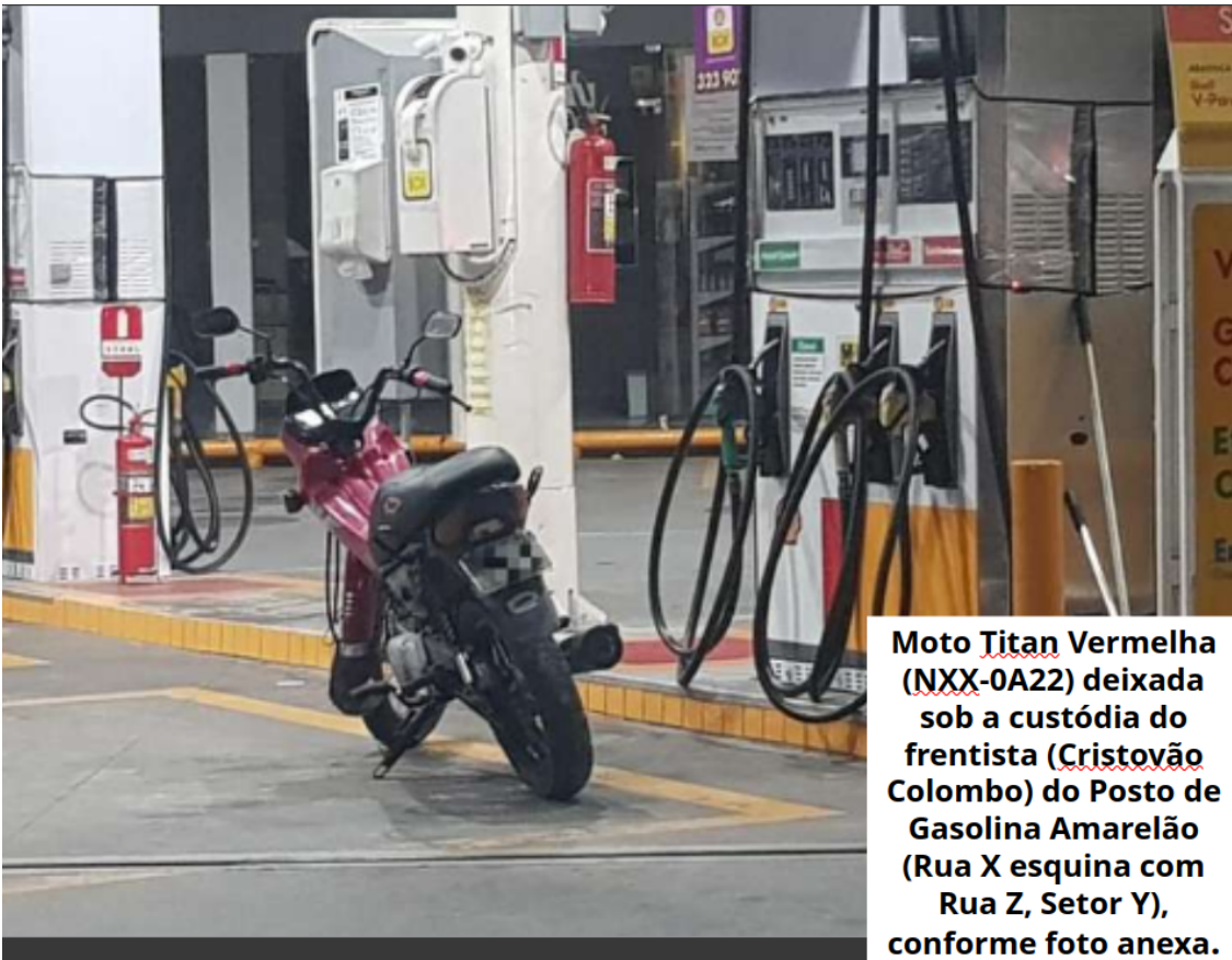
Moto Titan Vermelha (NXX-0A22) deixada sob a custódia do frentista (Cristovão Colombo) do Posto de Gasolina Amarelão (Rua X esquina com Rua Z, Setor Y), conforme foto anexa.

Ex.: Moto Titan Preta (NXX-0A22) deixada sob a custódia do frentista (Cristovão Colombo) do Posto de Gasolina Amarelão (Rua X esquina com Rua Z, Setor Y), conforme foto anexa;